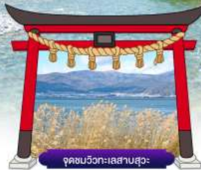
จุดชมวิวกะเลสาบสุวะ