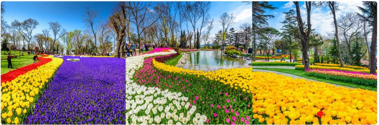
*ภาพเพื่อการโฆษณาเท่านั้น

สวนดอกทิวลิปหลากสีหลายสายพันธุ์นับล้านดอกที่สวยงามที่สุด และมีชื่อเสียงที่สุดของตุรกี ตลอดเดือนเมษายน เทศกาลทิวลิปอิสตันบูล เป็นเทศกาลประจำปี โดยจะจัดในช่วง 3 สัปดาห์สุดท้ายของเดือนเมษายน เพื่อเฉลิมฉลองทั้งฤดูใบไม้ผลิ และความสำคัญของดอกทิวลิป ที่มีต่ออาณาจักรออตโตมัน และวัฒนธรรมตุรกี ปกติแล้วเทศกาลนี้จัดขึ้นที่สวนสาธารณะ ที่มีชื่อเสียงที่สุดของเมือง ให้ทุกท่านได้ถ่ายรูปตามอัธยาศัย