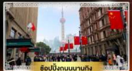
ช้อปปิ้งถนนนานกิง