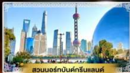
สวนนอร์คบันด์กรีนแลนด์