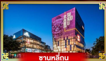
ซานหลี่กุน