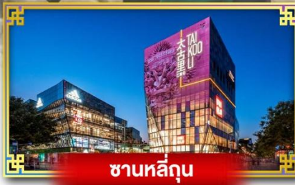
ซานหลี่กุน