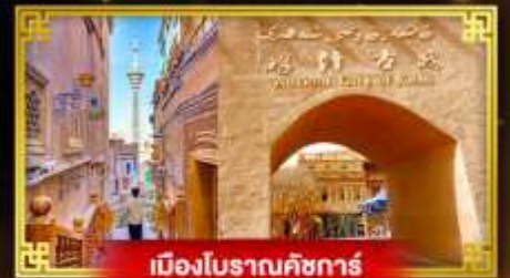
เมืองโบราณคัชการ