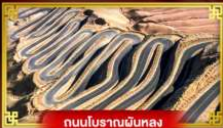
ถนนโบราณผืนหลง

“คัชการ” เที่ยวสุดขอบตะวันตกประเทศจีน เมืองเก่าแห่งยุคเส้นทางสายไหมโบราณ