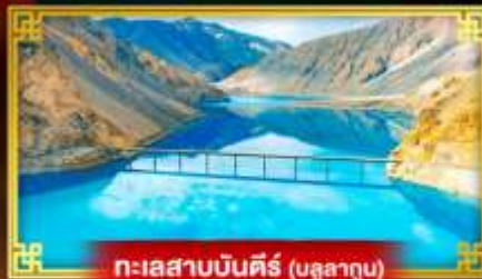
ทะเลสาบบันตีร์ (มูลาทุบ)