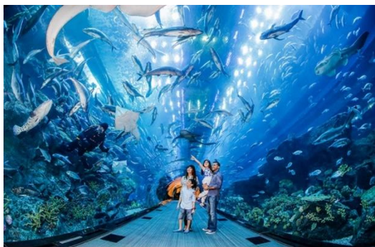
ความอุดมสมบูรณ์ของทะเลต่างๆ ทั่วโลก

***สามารถเลือกซื้อ Sea. Aquarium (โปรตแจ็งและชำระค่าบัตรก่อนเดินทาง ได้ในราคา ผู้ใหญ่ 1,350 บาท / เด็ก อายุต่ำกว่า 12ปี ราคา 1,190 บาท) S.E.A. Aquarium เป็นพิพิธภัณฑ์สัตว์น้ำเปิดใหม่ใหญ่ที่สุดในโลกกับ Marine Life Park จัดอันดับให้เป็นอควาเรียมใหญ่สุดในเอเชีย ตะวันออกเฉียงใต้ ถูกออกแบบให้เป็นอุโมงค์ใต้น้ำ สามารถบรรจุน้ำเค็ม ได้กว่า 45 ล้านลิตร รวมสัตว์ทะเลกว่า 800 สายพันธุ์ รวบรวมสัตว์น้ำ กว่า 100,000 ตัว ตกแต่งด้วยซากปรักหักพังของเรือ ภายในได้จำลอง