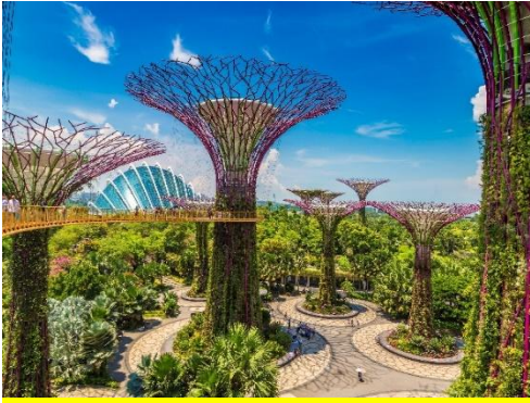
ค่าบัตร SUPERTREE 15 SGD หรือ 405 บาท )

จากนั้นเข้าชม GARDEN BY THE BAY อีสระให้ท่านได้ชมการจัดสวนที่ใหญ่ที่สุดบนเกาะสิงคโปร์ ชื่นชมกับต้นไม้ขนาดยักษ์ และเป็นศูนย์กลางการพัฒนาอย่างต่อเนื่องแห่งชาติของ Marina Bay บริหารโดยคณะกรรมการอุทยานแห่งชาติสิงคโปร์ นอกจากนี้ยังมีทางเดินลอยฟ้าเชื่อมต่อกับ Super tree คู่ที่มีความสูงเข้าด้วยกัน มีไว้สำหรับให้ผู้ที่มาเยือนสามารถมองเห็น สวนจากมุมสูงขึ้น 50 เมตร บนยอดของ Super tree สามารถเห็นทัศนียภาพอันงดงามของอ่าวและสวนโดยรอบ (ไม่รวม