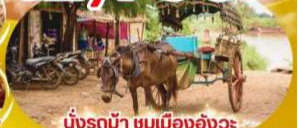
นั่งรถม้า ชมเมืองอังวะ