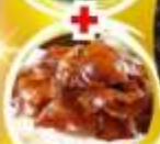
เปิดปากถึง