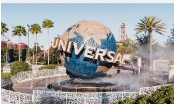
สวนสนุกยูนิเวอร์แซลปักกิ่งสตูดิโอ