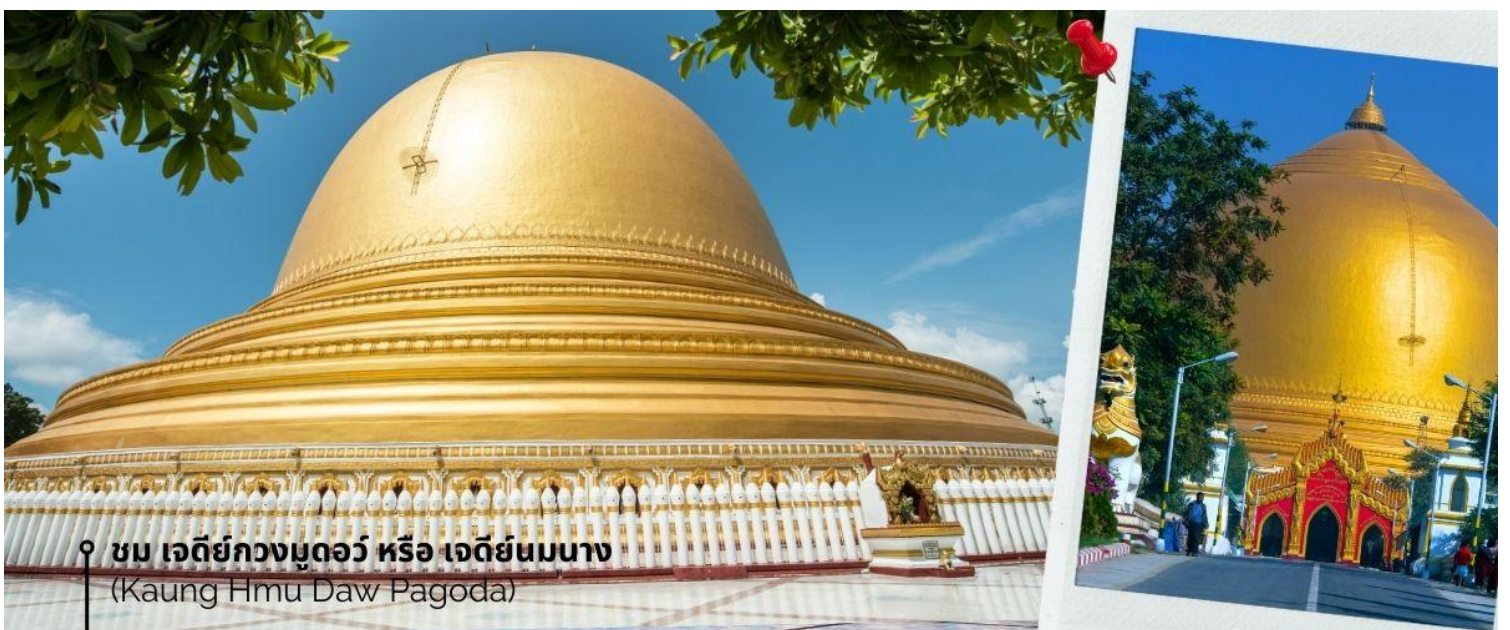
ชม เจดีย์กวงมุดอว์ หรือ เจดีย์นมนาง (Kaung Hmu Daw Pagoda)

นำท่านชม เจดีย์กวงมุดอว์ หรือ เจดีย์นมนาง (Kaung Hmu Daw Pagoda) เป็นเจดีย์พุทธขนาดใหญ่ ตั้งอยู่เขตชานเมืองทางตะวันตกเฉียงเหนือของชะโก้ง โดยจำลองตามสวัณณมาลีมหาเจดีย์ ในประเทศศรีลังกา ฐานชั้นล่างสุดของเจดีย์ประดับด้วยพระและเทวดา 120 องค์ ล้อมรอบด้วยโคมหิน 802 ต้น ซึ่งแกะสลักพร้อมจารึกพุทธประวัติสามภาษาได้แก่ พม่า, มอญ และไทใหญ่ เป็นตัวแทนของสามภูมิภาคหลักสมัยอาณาจักรตองอูยุคฟื้นฟู โดมของเจดีย์ได้รับการทาสีขาวอย่างต่อเนื่อง เพื่อแสดงถึง