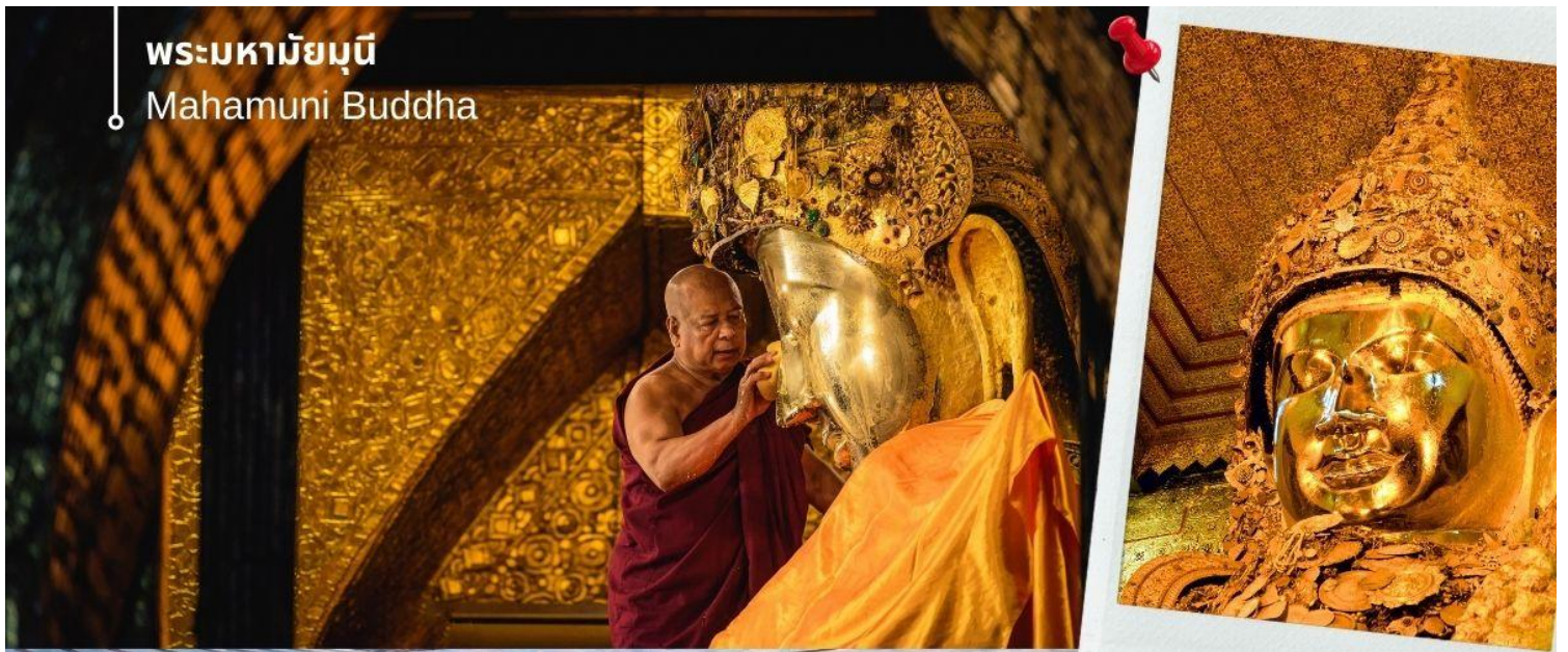
พระมหามัญมุนี Mahamuni Buddha

พระพุทธเจ้า ก่อนใช้ผ้าจากศรัทธาสาธุชนที่ถวายมาเช็ดจนแห้งสนิท แล้วนำกลับคืนแก่สาธุชนผู้นั้นไปบูชาต่อ พร้อมใช้พัดทองโบกถวายเป็นอันดี เสมือนหนึ่งได้อุปฐากองค์สมเด็จพระสัมมาสัมพุทธเจ้าที่ยังทรงพระชนมชีพอยู่ พระมหามัญนี่มีอีกพระนามหนึ่งว่า "พระเนื้อนุ่ม" ซึ่งเกิดจากการปิดทองซ้ำแล้วซ้ำอีกจนเป็นรอยย่นตะปุ่มตะป่ำไปทั่วทั้งองค์ ซึ่งหากเอานิ้วกดลงไปจะรู้สึกได้ถึงความอ่อนนุ่มของทองคำเปลวที่ปิดทับซ้อนกันนับเป็นพัน ๆ หมื่น ๆ ชั้น สมควรแก่เวลานำท่านเดินทางกลับเข้าสู่ที่พัก