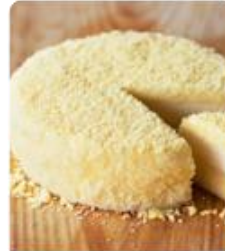
ร้าน LeTAO ร้านนี้ผลิตเค้กแสนอร่อย ด้วยบรรยากาศใน ร้านที่ตกแต่งสวยไปที่ไหนมาไม่ถึง ชิมแล้ว ต้องหลงใหลจนลืมคิดไปถึงที่