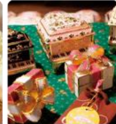
กล่องดนตรี MUSIC BOX