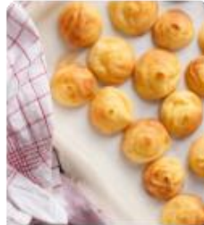
ร้าน KITAKARO ซึ่งมีขนมแบบอบจากเตาตุงๆ 100 กว่า ให้เลือกรับประทานกันเลยทีเดียว และเหมาะที่จะซื้อของฝากเป็นอย่างดี