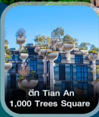
ตึก Tian An 1,000 Trees Square