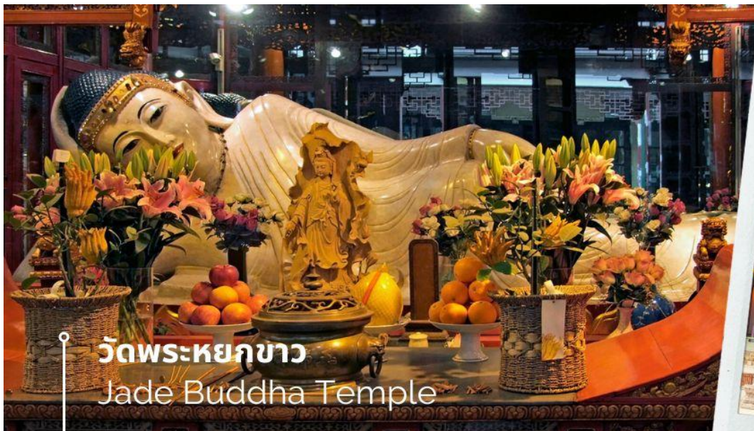
วัดพระหยกขาว Jade Buddha Temple

หลังรับประทานอาหารเช้า นำท่านชม วัดพระหยกขาว Jade Buddha Temple เป็นวัดที่มีชื่อเสียงมากที่สุดในเมืองเซี่ยงไฮ้ ซึ่งเป็นที่รู้จักจากพระพุทธรูปสององค์ที่สร้างขึ้นจากหยกทั้งแท่ง องค์พระพุทธรูปปางนั่งมีความสูง 190 เซนติเมตร และ หุ้มด้วยเพชรพลอย หิน มโนรา และ มรกต และองค์พระพุทธรูปปางไสยาสน์ มีความยาว 96 เซนติเมตร นอนเอียงด้านขวาและหนุนพระเศียรด้วยพระหัตถ์ขวา ถือเป็นวัดที่มีทั้งชาวจีนและนักท่องเที่ยวเดินทางมาสักการะบูชาตลอดทั้งวัน