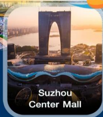
Suzhou Center Mall