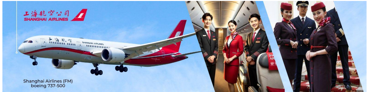
Shanghai Airlines (FM) boeing 737-500

02.00 น. พร้อมกันที่ ท่าอากาศยานสุวรรณภูมิ ณ อาคารผู้โดยสารชั้น 4 เคาน์เตอร์ U สายการบิน Shanghai Airlines (FM) โดยมีเจ้าหน้าที่จากทางบริษัทฯ คอยต้อนรับ และอำนวยความสะดวกแก่ท่าน