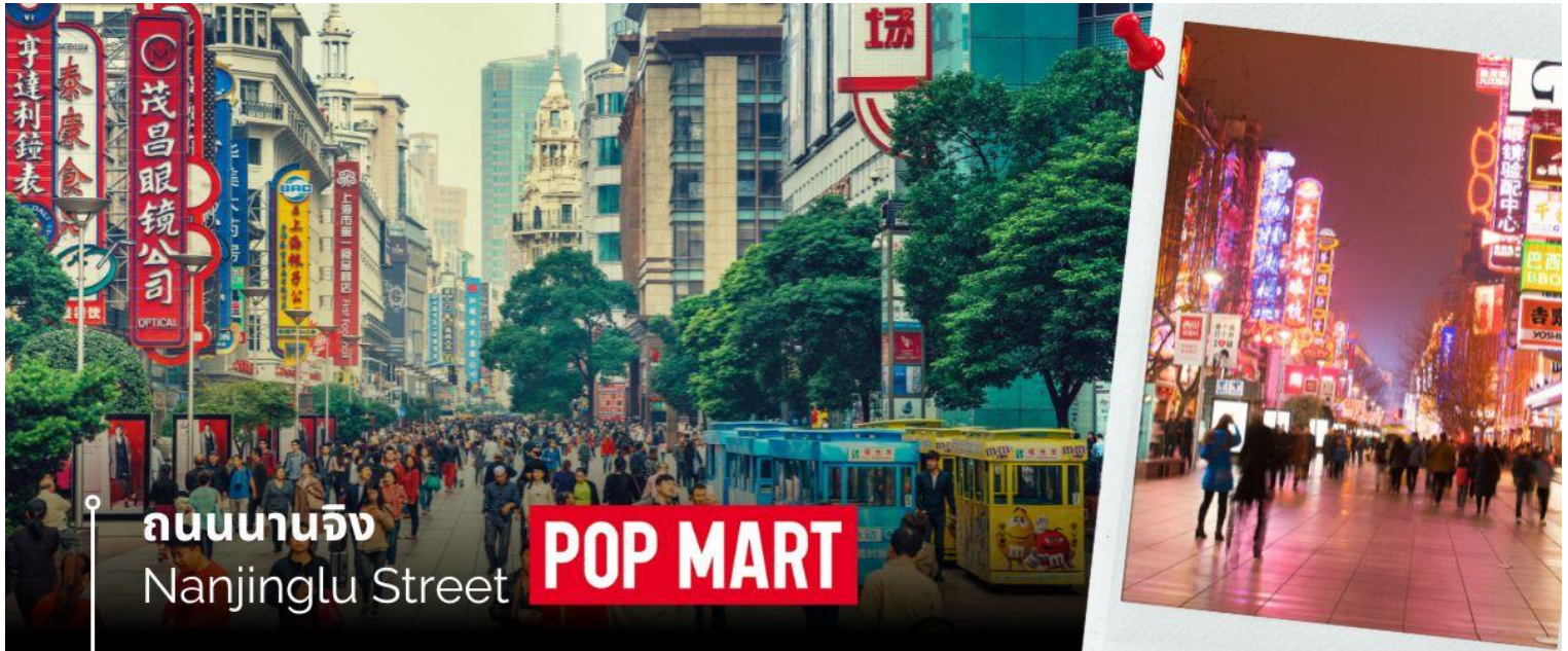
ถนนนานจิง Nanjinglu Street

จากนั้นนำท่านสู่บริเวณ หาดไ่ว่ทาน ตั้งอยู่บนฝั่งตะวันตกของแม่น้ำหวงผู้มีความยาวจากเหนือจรดใต้ถึง 4 กิโลเมตร เป็นเขตสถาปัตยกรรมที่ได้ชื่อว่า “พิพิธภัณฑ์สิ่งก่อสร้างหมื่นปีแห่งชาติจีน” ถือเป็นสัญลักษณ์ที่โดดเด่นของนครเซี่ยงไฮ้ให้ท่านได้ชมวิวดูหาดไ่ว่ทานในยามเย็นและนำท่านช้อปปิ้งย่าน ถนนนานจิง Nanjinglu Street ศูนย์กลางสำหรับการช้อปปิ้งที่คึกคักมากที่สุดของนครเซี่ยงไฮ้ รวมทั้งห้างสรรพสินค้าใหญ่ชื่อดังกว่า 10 แห่ง และช้อปปิ้ง ร้าน POP MART สุดฮิตในขณะนี้เพื่อเป็นของฝากที่ระลึก