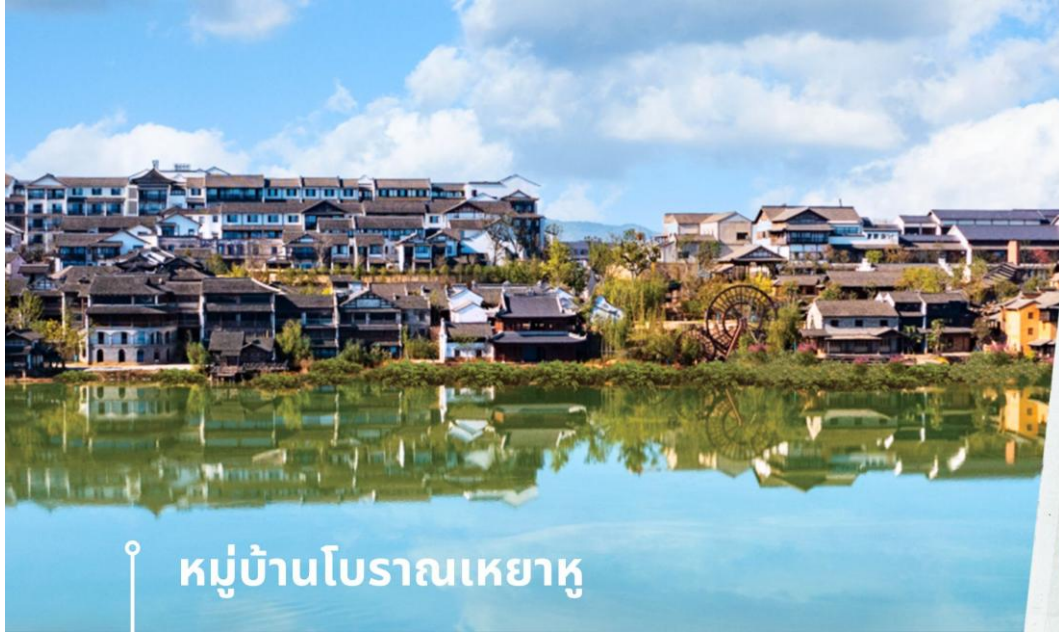
หมู่บ้านโบราณเหยาหู

หลังรับประทานอาหารเช้า ให้ท่านให้ใช้เวลาเพลิดเพลิน ไปด้วยการถ่ายรูปในมุมต่างๆ และกิจกรรมที่น่าสนใจในหมู่บ้านเหยาหู จากนั้น ชมโชว์ในหมู่บ้านเหยาหู เป็นโชว์วัฒนธรรมพื้นเมือง และศิลปะการแสดงต่างๆภายในหมู่บ้าน