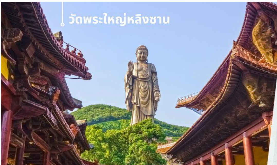
วัดพระใหญ่หลังซาน

หลังรับประทานอาหารเช้าเที่ยง นำท่านเดินทางสู่ เมืองอู่ซี นำท่านชม วัดพระใหญ่หลังซาน (นั่งรถราง) ตั้งอยู่ที่เมืองอู่ซี มณฑลเจียงซู ประเทศจีน สิ่งที่เห็นแบบเด่นชัดเมื่อมาเที่ยวที่วัดนี้คือ “หลังซานต้าผอ” หรือ “พระใหญ่หลังซาน” พระพุทธรูปองค์ใหญ่ที่ใหญ่ที่สุดองค์หนึ่งในประเทศจีนและในโลก เป็นพระพุทธรูปปางยืนของพระอมิตาภพุทธะแบบ สัมฤทธิ์กลางแจ้ง หนักกว่า 7,000 เมตริกตัน สร้างเสร็จเมื่อปลายปี ค.ศ. 1996 มีความสูงกว่า 88 เมตร (289 ฟุต) รวมฐานบัว 9 เมตร นักท่องเที่ยวทั้งชาวจีนและชาวต่างชาตินิยมมาขอพรเพื่อความสิริมงคลและความสำเร็จในหน้าที่การงาน การเดินทางให้แคล้วคลาดปลอดภัย โดยการกราบและลูบที่เท้าท่าน ซึ่งภายในพระพุทธรูปยังมีพิพิธภัณฑสถานมีชีวิตของท่านให้ได้เรียนรู้อีกด้วย ภายในประกอบไปด้วย ตำหนักฝานกง หรือ ศาลาฝานกง ตั้งอยู่ที่ริมทะเลสาบไท่หู ทาง