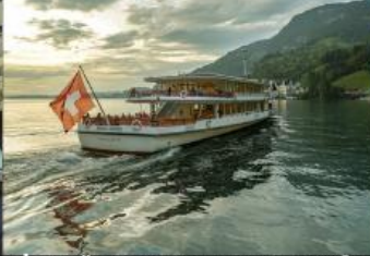
ล่องเรือชมวิวกะเสาสลูเซิร์น