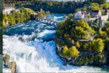
เขื่อนน้ำตกโรน