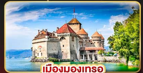
เมืองมงเทรอ