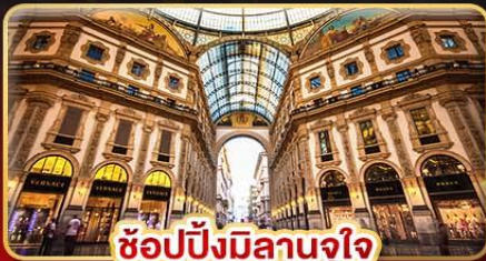
ช้อปปิ้งมิลานจุใจ

มากกว่าการท่องเที่ยว แต่ได้พักผ่อนเต็มที่ โปรแกรมไม่รีบเร่ง