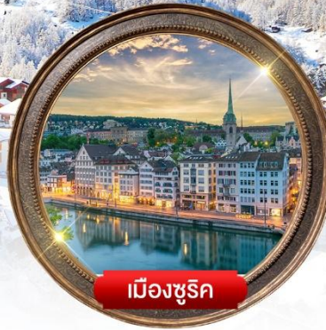
เมืองซูริก