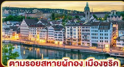
ตามรอยสหายนู๋ทอง เมืองซูริค