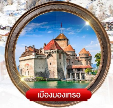
เมืองมงเทรอ