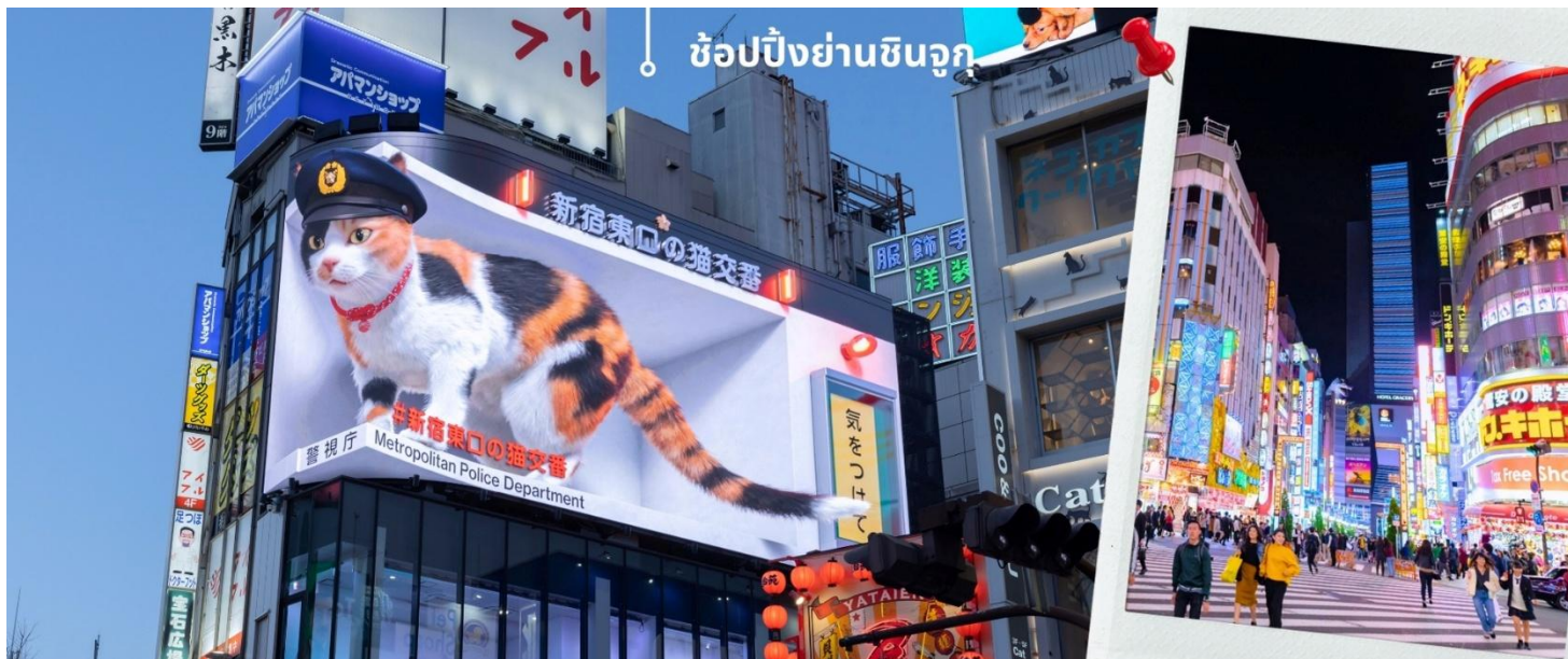
ช้อปปิ้งย่านชินจูกุ

จากนั้นเดินทางเข้าสู่ย่าน ซ้อปิ้งชินจูกุ Shinjuku แหล่งช้อปปิ้งชื่อดังในโตเกียวให้ท่านอิสระและเพลิดเพลินกับการช้อปปิ้งสินค้ามากมายทั้งเครื่องใช้ไฟฟ้ากล้องถ่ายรูปดิจิตอลนาฬิกา เครื่องเล่นเกม หรือสินค้าที่จะเอาใจคุณผู้หญิงด้วยกระเป๋า รองเท้า เสื้อผ้าแบรนด์เนม เสื้อผ้าแฟชั่นสำหรับวัยรุ่น เครื่องสำอางยี่ห้อดังของญี่ปุ่นไม่ว่าจะเป็น KOSE, KANEBO, SK II, SHISEDO และอื่นๆอีกมากมาย