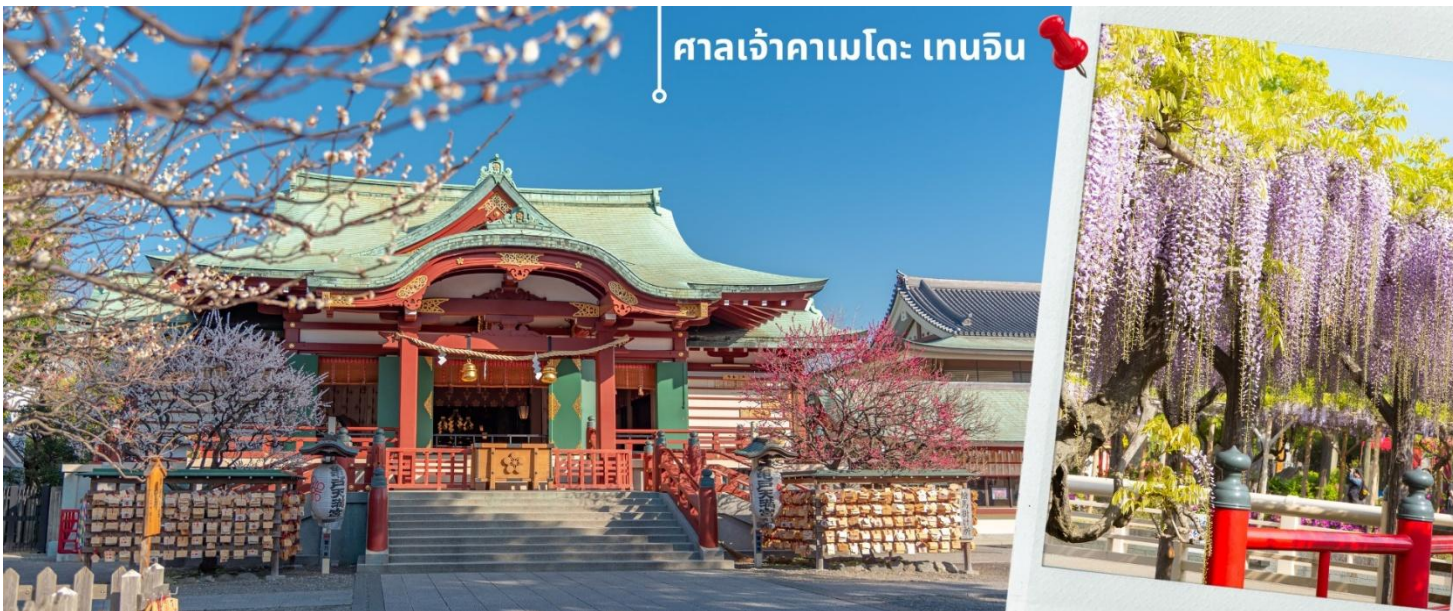
ศาลเจ้าคาเมโตะ เกนจิน

** ระยะเวลาการบานของดอกไม้จะขึ้นอยู่กับสายพันธุ์ ฤดูกาล และสภาพอากาศ **