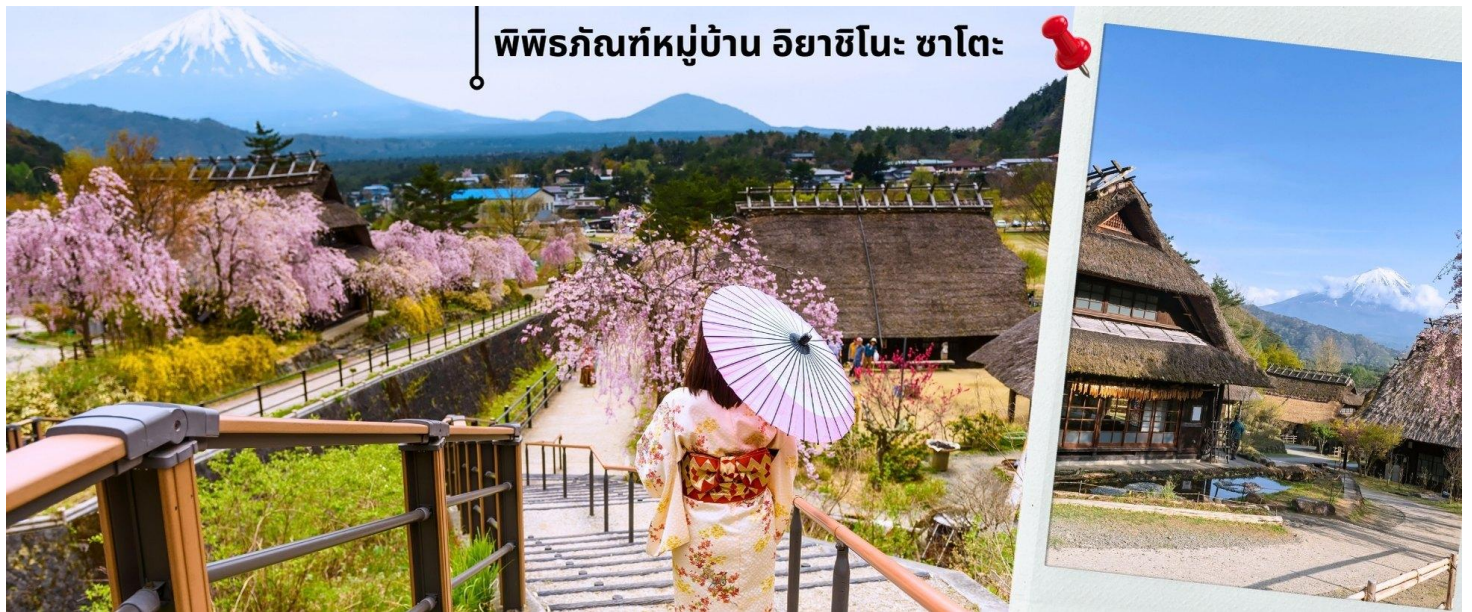
พิพิธภัณฑ์หมู่บ้าน อียาชิโนะ ซาโตะ

หลังรับประทานอาหารเช้า นำท่านเดินทางเข้าชม พิพิธภัณฑ์หมู่บ้านอียาชิโนะซาโตะ Saiko Iyashi No Sato ซึ่งตั้งอยู่บริเวณฝั่งตะวันตกของทะเลสาบไซโกะ เป็นหมู่บ้านโบราณที่ได้รับการบูรณะและฟื้นฟูขึ้นมาใหม่หลังจากถูกทำลายโดยพายุไต้ฝุ่นในปี 1966 ปัจจุบันกลายเป็นพิพิธภัณฑ์กลางแจ้งที่มีเอกลักษณ์ที่ผสมผสานประวัติศาสตร์ วัฒนธรรม และทัศนียภาพธรรมชาติอันงดงามเข้าด้วยกัน ให้ท่านได้สัมผัสวิถีชีวิตดั้งเดิมของชาวญี่ปุ่นในยุคโบราณ ท่ามกลางวิวภูเขาไฟฟูจิที่งดงาม และไฮไลท์ของการเที่ยวพิพิธภัณฑ์หมู่บ้านอียาชิโนะซาโตะ คือตลอด 2 ข้างทางจะมีต้นซากุระขึ้นเรียงรายยิ่งทำให้ช่วยเพิ่มความสวยงามให้กับบรรยากาศโดยรอบบ้านที่หลังคามุงฟางรับกับวิวภูเขาไฟฟูจิเก็บไว้เป็นที่ระลึก