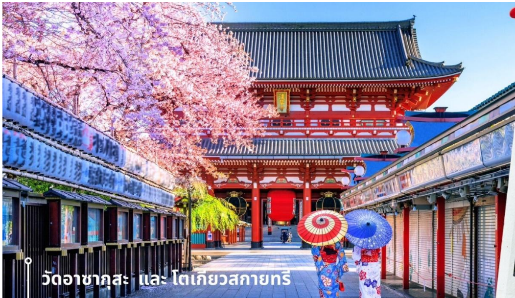
วัดอาซากุสะ และ โตเกียวสกายทรี

08.00 น. เดินทางถึงสนามบินนาริตะ ประเทศญี่ปุ่น หลังจากผ่านพิธีตรวจคนเข้าเมืองและศุลกากรแล้ว นำท่านขึ้นรถโค้ชปรับอากาศ จากนั้นเดินทางสู่ เมืองโตเกียว พาท่านสักการะ ที่ วัดอาซากุสะ Asakusa Temple วัดที่ได้ชื่อว่าเป็นวัดที่มีความศักดิ์สิทธิ์และได้รับความเคารพนับถือมากที่สุดแห่งหนึ่งในกรุงโตเกียวภายในประดิษฐานองค์เจ้าแม่กวนอิมทองคำที่มักจะมีผู้คนมาราบไหว้ขอพรเพื่อความเป็นสิริมงคลตลอดทั้งปีประกอบกับ