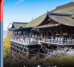
วัดคิโยมิจิ