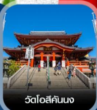
วัดโอสึคันนง