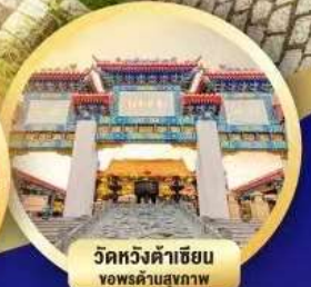
วัดหวงต้าเซียน จพรค้ำสุขภาพ