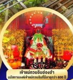
เจ้าแม่กวนอิมฮ่องง่า นบิการองค์เจ้าแม่กวนอิมที่มีอายุกว่า 600 ปี