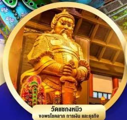
วัดเขangkหมิว จพรโชคลาก การเงิน และธุรกิจ