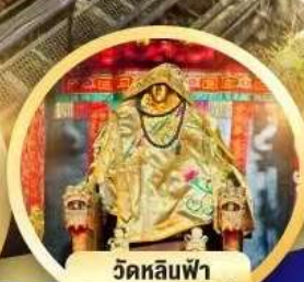
วัดหลินฟ้า โชคลากและความมั่งคั่ง