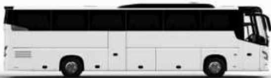
ตัวอย่างรถโดยสาร 1 คัน

ค่าที่พักตามที่ระบุในรายการหรือเทียบเท่าระดับเดียวกัน (พักห้องละ 2 ท่าน) หากประเภทห้องที่ท่านริเสกขมาเดิม อาทิ เช่น ริเสกขห้องพักเป็น TWIN BED หรือ DOUBLE BED ทางบริษัทขอสงวนสิทธิ์ในการปรับประเภทห้องพัก เป็นตามโรงแรมที่มีอยู่ โดยไม่ต้องแจ้งให้ทราบล่วงหน้า