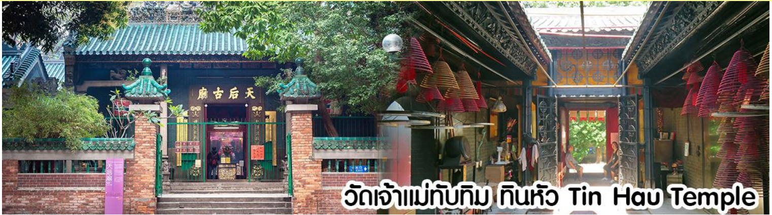
วัดเจ้าแม่ทับทิม ทินฮั่ว Tin Hau Temple

นำทุกท่าน ไหว้ศาลเจ้าแม่ทับทิม ทินฮั่ว (Tin Hau Temple) เป็นวัดเก่าแก่และสำคัญอีกวัดหนึ่งของฮ่องกง เพราะในสมัยก่อนฮ่องกงเป็นเพียงหมู่บ้านชาวประมง ซึ่งเคารพนับถือเจ้าแม่ทับทิมว่าเป็นเทพีแห่งทะเล เพื่อให้เดินทางปลอดภัย เวลาออกไปทำงานไกล ๆ หรือออกหาปลา นอกจากการมาสักการะบูชาเจ้าแม่ทับทิมในเรื่องของการเดินทางให้ปลอดภัยแล้ว ไฮไลท์สำคัญอีกอย่างหนึ่งของ วัดเจ้าแม่ทับทิม ทินฮั่ว (Tin Hau Temple) จะเป็นขดรูปสีแดงขนาดใหญ่ ที่แขวนอยู่ตามเพดานด้านในวิหารของวัดเต็มไปหมด จะยิ่งสวยงามในยามที่มีแสงแดงส่องลงมาเหมือนเป็นลำแสงส่องทะลุวันรูปแปลกตายิ่งนัก ส่วนอาคารของวัดก็จะเป็นสถาปัตยกรรมแบบวัดจีน สร้างขึ้นตั้งแต่ปีค.ศ. 1876 โดยทางเข้าของวัดจะอยู่ติดกับสวนสาธารณะเล็ก ๆ ที่มีต้นไม้ใหญ่หลายต้น ให้บรรยากาศร่มรื่น