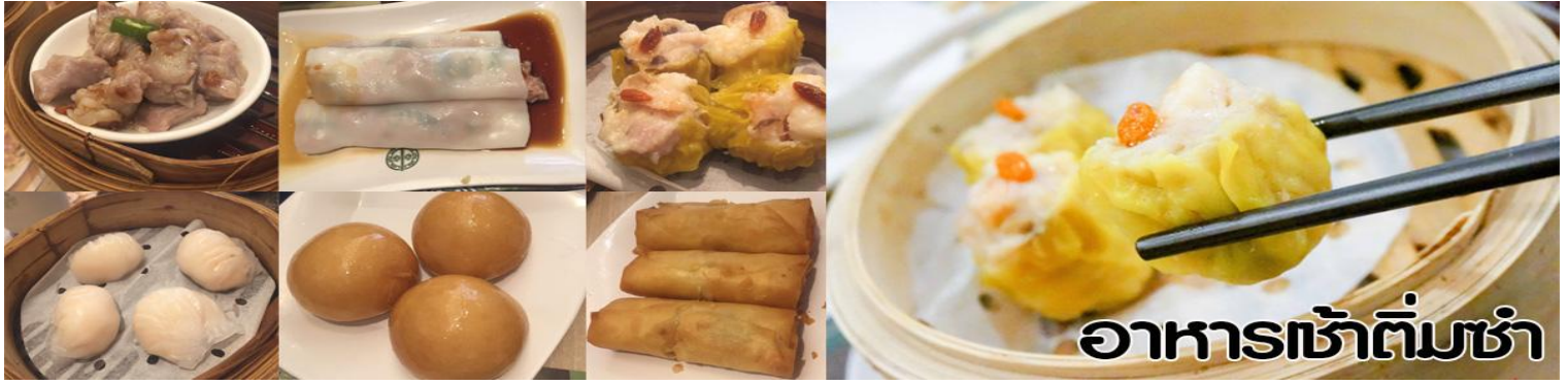
อาหารเช้าต้มซ่า

นำทุกท่าน ไหว้ศาลเจ้าแม่ทับทิม ทินฮั่ว (Tin Hau Temple) เป็นวัดเก่าแก่และสำคัญอีกวัดหนึ่งของฮ่องกง เพราะในสมัยก่อนฮ่องกงเป็นเพียงหมู่บ้านชาวประมง ซึ่งเคารพนับถือเจ้าแม่ทับทิมว่าเป็นเทพีแห่งทะเล เพื่อให้เดินทางปลอดภัย เวลาออกไปทำงานไกล ๆ หรือออกหาปลา นอกจากการมาสักการะบูชาเจ้าแม่ทับทิมในเรื่องของการเดินทางให้ปลอดภัยแล้ว ไฮไลท์สำคัญอีกอย่างหนึ่งของ วัดเจ้าแม่ทับทิม ทินฮั่ว (Tin Hau Temple) จะเป็นขดรูปสีแดงขนาดใหญ่ ที่แขวนอยู่ตามเพดานด้านในวิหารของวัดเต็มไปหมด จะยิ่งสวยงามในยามที่มีแสงแดงส่องลงมาเหมือนเป็นลำแสงส่องทะลุวันรูปแปลกตายิ่งนัก ส่วนอาคารของวัดก็จะเป็นสถาปัตยกรรมแบบวัดจีน สร้างขึ้นตั้งแต่ปีค.ศ. 1876 โดยทางเข้าของวัดจะอยู่ติดกับสวนสาธารณะเล็ก ๆ ที่มีต้นไม้ใหญ่หลายต้น ให้บรรยากาศร่มรื่น