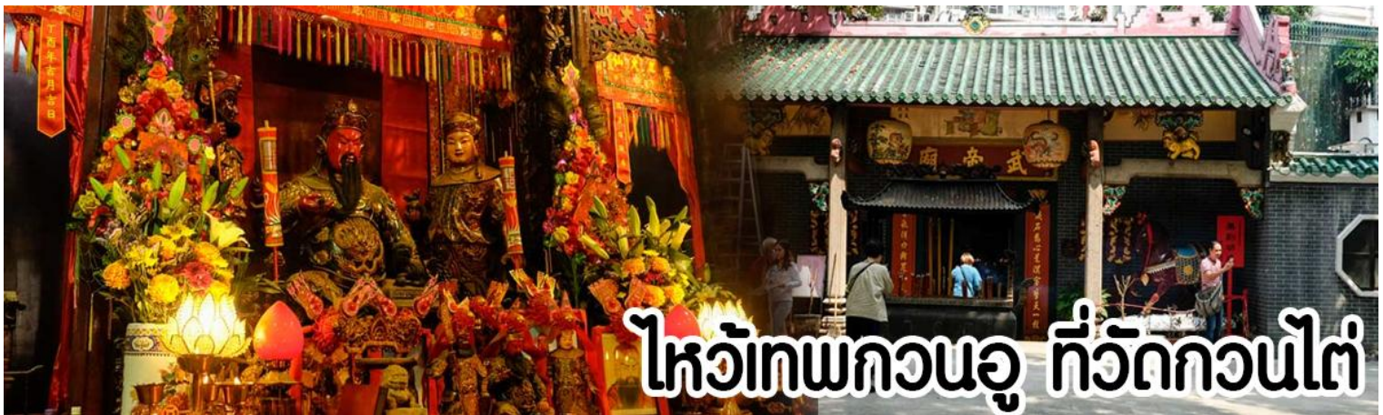
ไหว้เทพกวนอู ที่วัดกวนไต้

หลังจากนั้นขอพรเทพเจ้ากวนอู ณ วัดกวนไต้ วัดเก่าแก่สร้างขึ้นในปีพ.ศ. 2434 เป็นวัดเดียวในเกาลูนที่บูชาเทพ เจ้ากวนอูเป็นเทพผู้ยิ่งใหญ่ เทพเจ้าแห่งความซื่อสัตย์ โชคลาภ บารมี