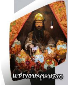
ช่างงนงนง