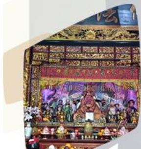
วัดเชิงเชิง+เทพนาคา