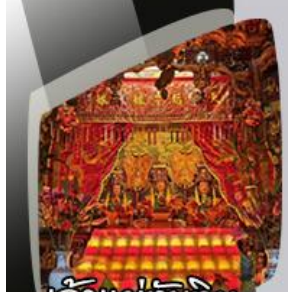
เจ้านมทับทิม Joss House Bay