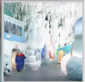
"KAMIKAWA ICE PAVILLION"