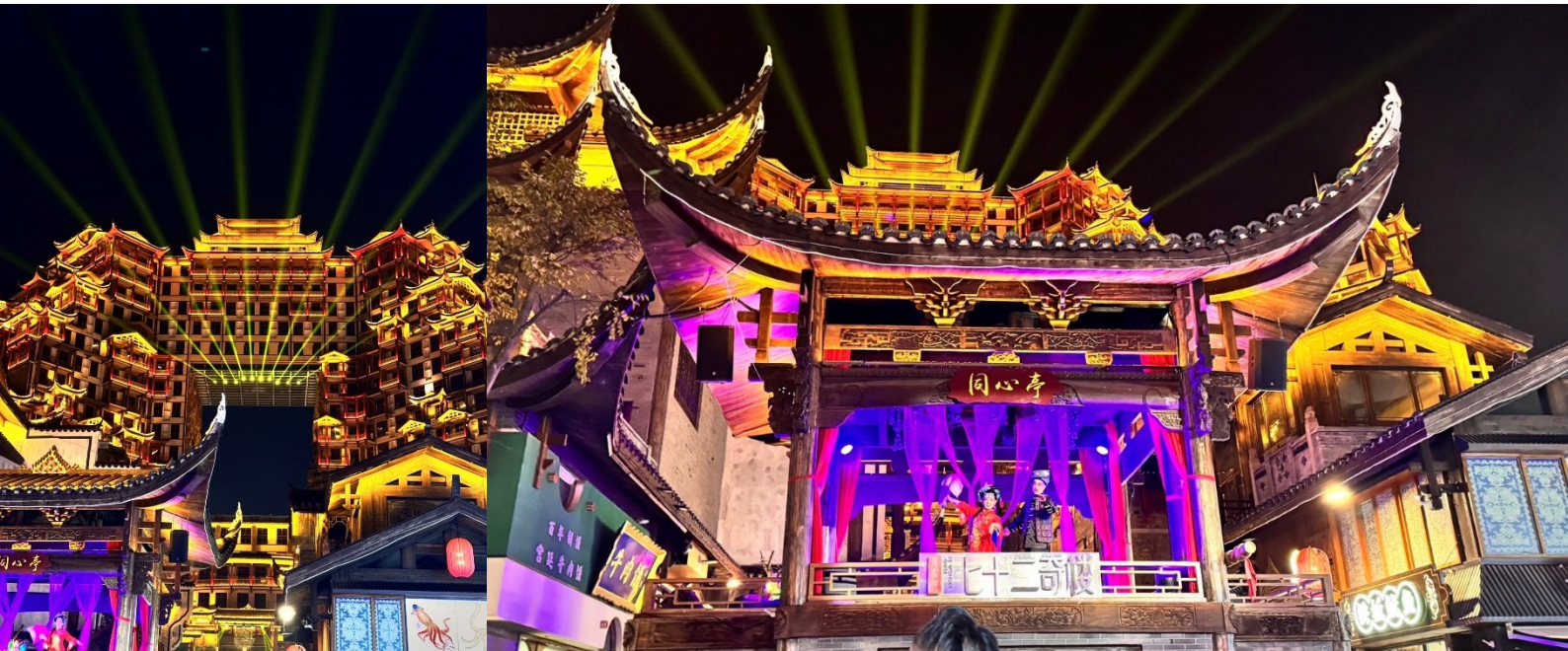
นำทุกท่านเข้าสู่ที่พัก SUNSHINE HOTEL ZHANGJIAJIE ระดับ 5 ดาวท้องถิ่นหรือเทียบเท่า

จากนั้นนำท่านชม ตึกมหัตศรรรย์ 72 แห่งเมืองจางเจี๋ยเจี๋ย แลนด์มาร์คใหม่ล่าสุดที่เป็นเสมือนแม่เหล็กดึงดูดนักท่องเที่ยวและผู้มาเยือน ถูกสร้างขึ้นโดยนำเอาจุดเด่นของเมืองจางเจี๋ยเจี๋ยมารวมกัน โดยมีอาคารสูงที่สร้างจำลองถ้ำประตูสวรรค์ บ้านยกพื้นโบราณที่เป็นบ้านพื้นเมืองของชาวถู่เจี๋ย นอกจากนี้ที่นี่ยังถูกออกแบบให้กลายเป็นแหล่งรวมของ รีสอร์ท โฮมสเตย์ ร้านอาหาร แผงสตรีทฟู้ด ผับบาร์ ร้านขายของที่ระลึก ที่ตกแต่งด้วยแสงสีสุดอลังการ (รวมบัตรเข้าชม)