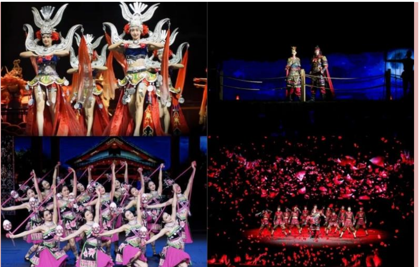
Option Show : ตำนานรักพันปี ท่านละ 320 หยวน

จากนั้นนำท่านแวะชม ผลิตภัณฑ์น้ำมันตับปลา แหล่งรวมผลิตภัณฑ์จาก ผู้นำด้านการวิจัยและพัฒนา ผลิตภัณฑ์จากสาหร่ายและทรัพยากรทางทะเลมายาวนานหลายทศวรรษ ด้วยเทคโนโลยีชีวภาพขั้นสูง ผสมผสานกับพลังธรรมชาติจากท้องทะเลสะอาดที่สุดในโลก สู่ผลิตภัณฑ์หลากหลายที่ดีที่สุดสุขภาพ ไม่ว่าจะ เป็น อาหารทะเลแปรรูปเพื่อสุขภาพ, เครื่องสำอางจากสารสกัดสาหร่าย, ผลิตภัณฑ์ดูแลร่างกายจาก แร่ธาตุทะเลลึก, ไปจนถึง อาหารเสริมบำรุงภูมิคุ้มกัน และ ของใช้ประจำวันที่เป็นมิตรกับสิ่งแวดล้อม ทุก ชิ้นผ่านการคัดสรรอย่างพิถีพิถัน และพัฒนาจากสารสกัดชีวภาพจากทะเลที่อุดมด้วยคุณค่าทางสุขภาพ