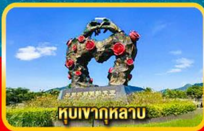
หุบเขากุหลาบ