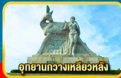
อุทยานกวางเหลียวหลิง

เมนูพิเศษ! ลิ้มรสไก้ไหหลำ, เซตซีฟู้ดกุ้งมังกร, ขันโตกข้าวเหนียวห้าสี, อาหารเจ ณ สวนพุทธธรรมหนานชาน