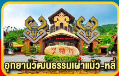
อุทยานวัฒนธรรมเผ่าแม้ว-หลี