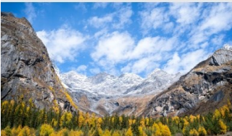
ภูเขาสี่ดรุณี (หุบเขาซวงเฉียวโกว)