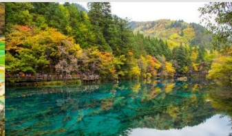
อุทยานแห่งชาติจิ่วจ้ายโกว