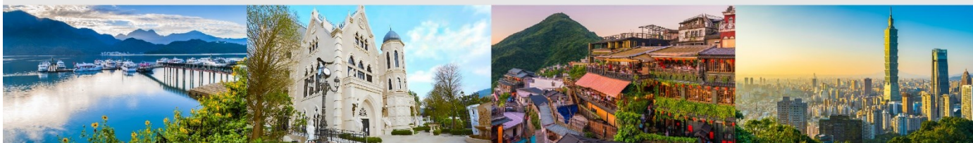
ล่องเรือทะเลสาบสุริยันจันทรา