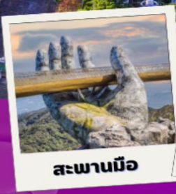
สะพานมือ