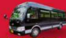
BUS (10-18 ท่าน)