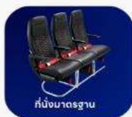
ที่นั่งมาตรฐาน