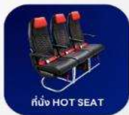
ที่นั่ง HOT SEAT