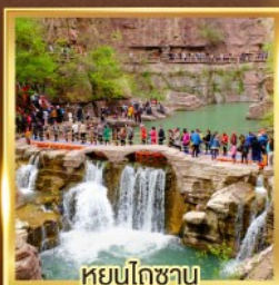
หยุ่นโกซาน