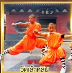
วัดเส้าหลิน