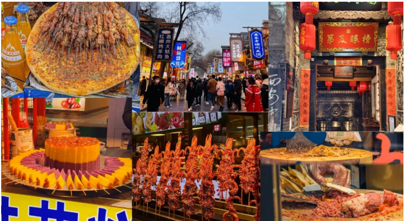
กลางวัน รับประทานอาหารกลางวัน ณ ภัตตาคาร (มื้อที่ 2)