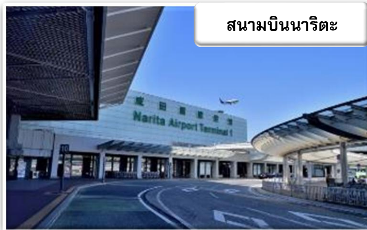
สนามบินนาริตะ

เวลา 06.20 น. เดินทางถึง สนามบินนาริตะ ประเทศญี่ปุ่น นำท่านผ่านขั้นตอนการตรวจคนเข้าเมืองและศุลกากร