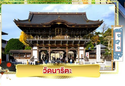
วัดนาริตะ