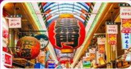
ตลาดปลาคุโรมง