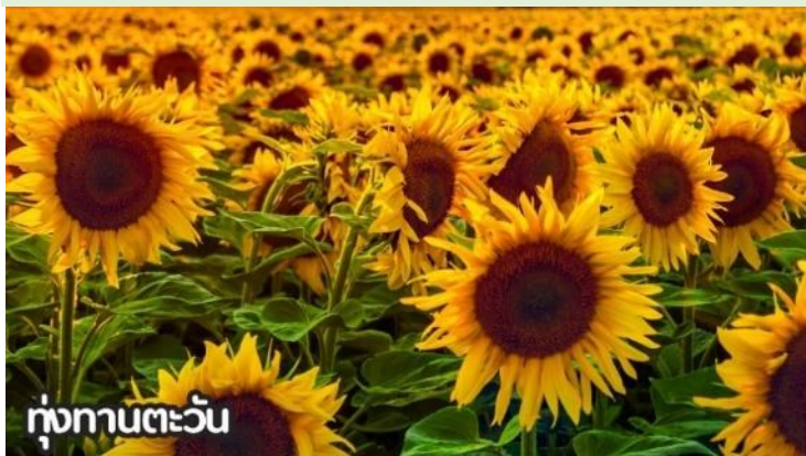
ทุ่งทานตะวัน