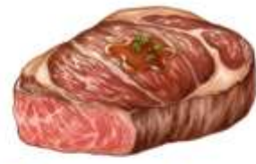
● ไก่ทานเนื้อหมู