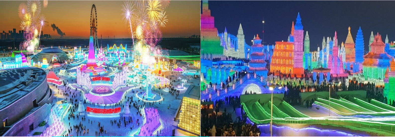
(อิสระอาหารค่ำ เพื่อความสะดวกในการท่องเที่ยว)

นำท่านชมความยิ่งใหญ่ของงานฤดูหนาวระดับโลก เทศกาลแกะสลักหิมะและน้ำแข็งแห่งเมืองฮาร์บิน ที่ใหญ่ที่สุดในโลก Harbin International Ice and Snow Festival ซึ่งใน 1 ปีจะจัดขึ้นเพียงครั้งเดียวเท่านั้นถ่ายรูปแบบประติมากรรมน้ำแข็งสุดอลังการที่ถูกแกะสลักโดยช่างฝีมือดีจากทั่วทุกมุมโลก โดยนำก้อนน้ำแข็งหลายหมื่นก้อนมาแกะสลักเพื่อประกอบเป็นรูปร่างต่างๆ จนกลายเป็นเมืองที่เหมือนหลุดออกมาจากเทพนิยาย มีปราสาทขนาดใหญ่สวยงามตระการตา ยามค่ำคืนจะเปิดไฟสีส้มสวยงาม นอกจากนี้ยังมีกิจกรรมอื่นๆ ที่น่าสนใจมากมาย เช่น นั่งรถม้าเที่ยวชมรอบๆ การเล่นสไลด์เดอร์น้ำแข็ง การเล่นกระดานลื่นน้ำแข็ง ถอดเสื้อผ้าว่ายนน้ำในสระน้ำท่ามกลางอากาศติดลบมากกว่า -20 องศา การเล่นไอซ์สเกต การเดินเข้าชมถ้ำน้ำแข็ง เป็นต้น (หมายเหตุ : เทศกาลแกะสลักหิมะ และน้ำแข็งแห่งเมืองฮาร์บิน ในแต่ละปีการแกะสลักรูปแบบอาจจะแตกต่างกันออกไป จะเริ่มเข้าชมได้ตั้งแต่ช่วงการเตรียมงาน หรือจนกว่าหิมะจะละลาย)