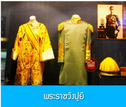
พระราชวังปูยี

หลังอาหารนำท่านเช็คเอาท์ออกจากโรงแรมที่พักแล้วเดินทางสู่ เมืองฉางชุน 长春市 (ระยะทาง 120 กม.ใช้เวลาเดินทางราว 1 ชั่วโมงครึ่ง)