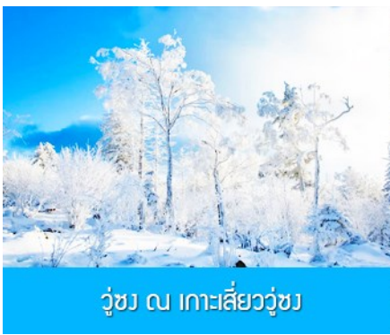
วู้ชง ณ เกาะสี่ยวู้ชง