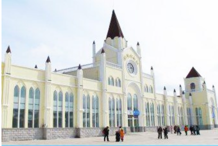
สถานีรถไฟยาบูลี

หมายเหตุ เพื่อความสะดวกในการเข้าพักใน HOME STAY ภายในหมู่บ้านหิมะ ทางทัวร์แนะนำให้ท่านจัดเตรียม เสื้อผ้าและเครื่องใช้เท่าที่จำเป็น 1 ชุดใส่กระเป๋าใบเล็กหรือเป้แบบสะพายได้ เพื่อสะดวกในการนำติดตัวไปใช้ สำหรับคืนที่นอนในหมู่บ้านหิมะ หากนำกระเป๋าเดินทางใบใหญ่เข้าสู่ที่พักในหมู่บ้านอาจสร้างความไม่สะดวกแก่ ท่าน จึงไม่แนะนำ