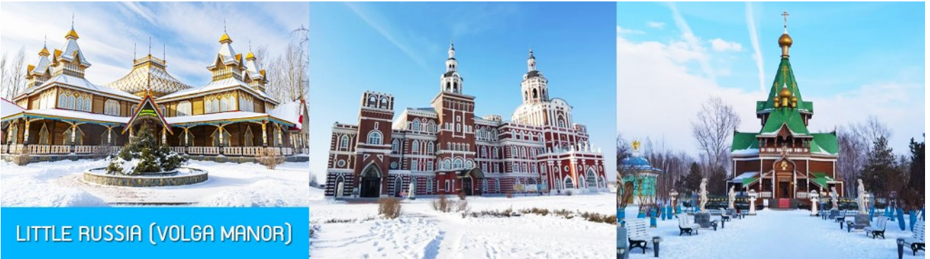
LITTLE RUSSIA (VOLGA MANOR)

เช้า รับประทานอาหารเช้า ณ ห้องอาหารของโรงแรม (13)