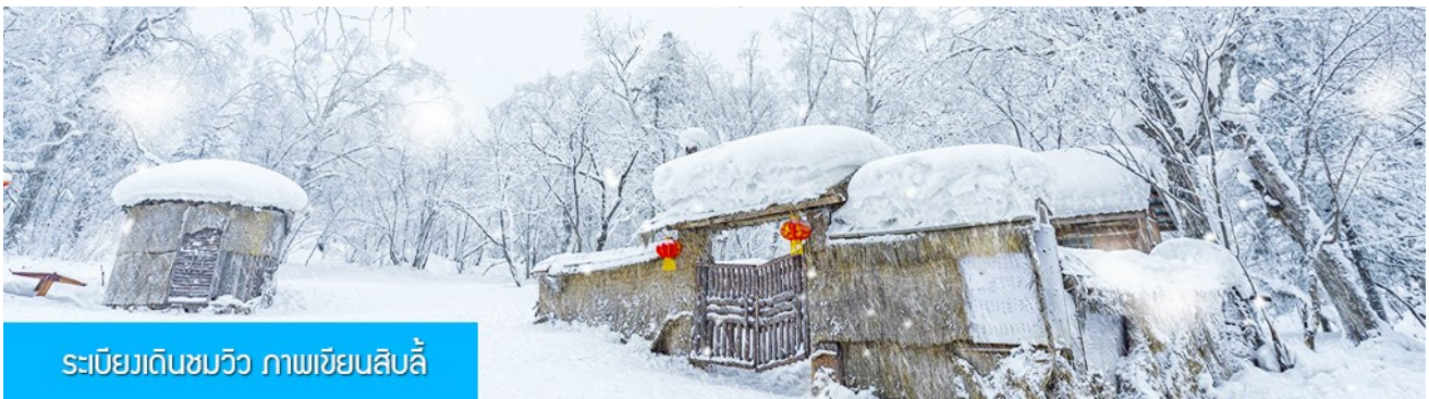
ระเบียบดินชมวิว ภาพเขียนสิบสี่