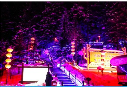
ระเบียงชมวิวยี่จู่ซาน