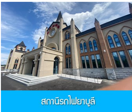
สถานีรถไฟยาบูลี

หลังอาหารนำท่านเดินทางสู่ ยาบูลี 亚布力 (ระยะทาง 230 กม. ใช้เวลาเดินทางราว 3 ชั่วโมงเศษ)