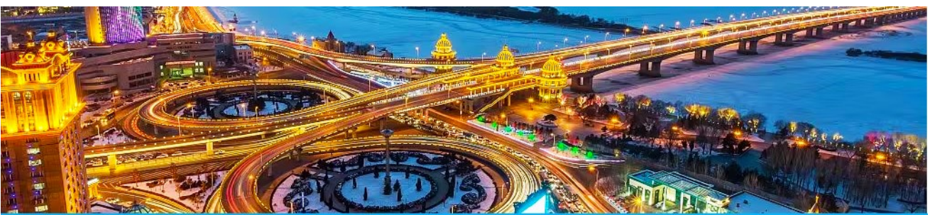
นครฮาร์บิน