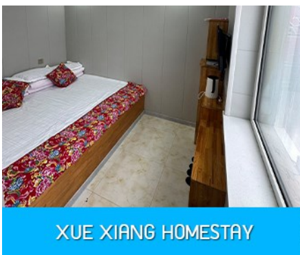
XUE XIANG HOMESTAY