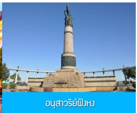
อนุสาวรีย์ผึ้ง

จากนั้นนำท่านชม โบสถ์โซเฟีย 索菲亚教堂 (ชมด้านนอก) อีกหนึ่งสัญลักษณ์ที่โดดเด่นของเมืองฮาร์บิน สร้างขึ้นในปี ค.ศ. 1907 เป็นโบสถ์คริสต์นิกายออร์ทอดอกซ์ ที่ใหญ่ที่สุดในเอเชียตะวันออก ที่แสดงถึงอิทธิพลของวัฒนธรรมรัสเซียที่มีต่อเมืองฮาร์บิน..