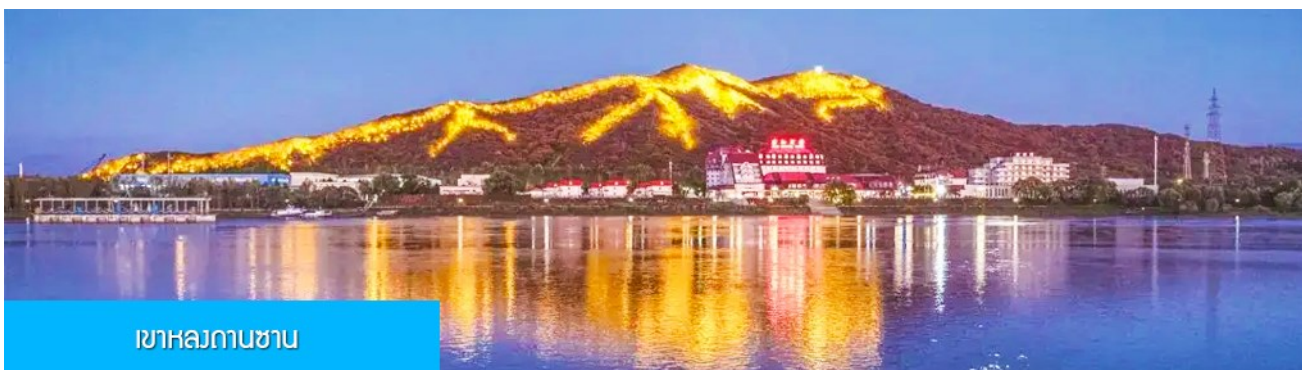
เขาสถกานซาน

หลังอาหารนำท่านผ่านชม วิวยามค่ำของเขา หลงถานซาน 龙潭山夜景 (ผ่านชมระยะไกล) ภูเขารูปทรงคล้าย มังกรในช่วงกลางคืนภูเขาจะถูกประดับด้วยแสงไฟที่สามารถมองเห็นแต่ไกล คล้ายรูปมังกร (บางคนมองว่าคล้ายรูปไดโนเสาร์) จากนั้นนำท่านเดินทางเข้าที่พัก