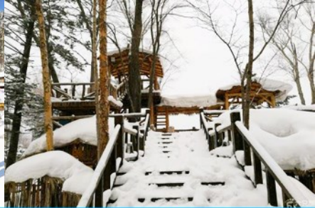
ระเบียงชมวิวปีงวูชาน

วันที่สาม เมืองฮาร์บิน-สถานีรถไฟยาบูลี-รวมนั่งม้าลากเลื่อน- หมู่บ้านหิมะ Xue xiang China Snow Town – ระเบียงชมวิว เขาปีงวูชาน- ชมแสงสียามราตรีหมู่บ้านหิมะ-ชมพลุไฟและขบวนพาเหรดระบำพื้นเมือง-นอนในหมู่บ้านหิมะ Xue xiang