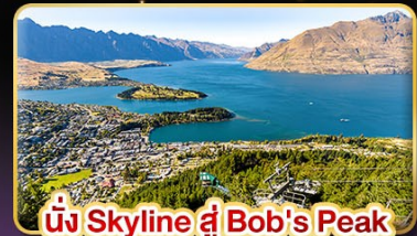
นั่ง Skyline สู่ Bob's Peak