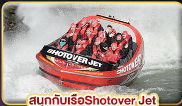
สนุกกับเรือShotover Jet