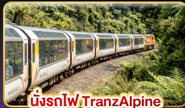
นั่งรถไฟTranzAlpine