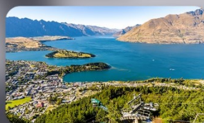
นั่ง Skyline สู่ Bob's Peak