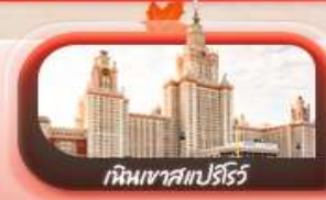
เท็มพาสเปร์โร